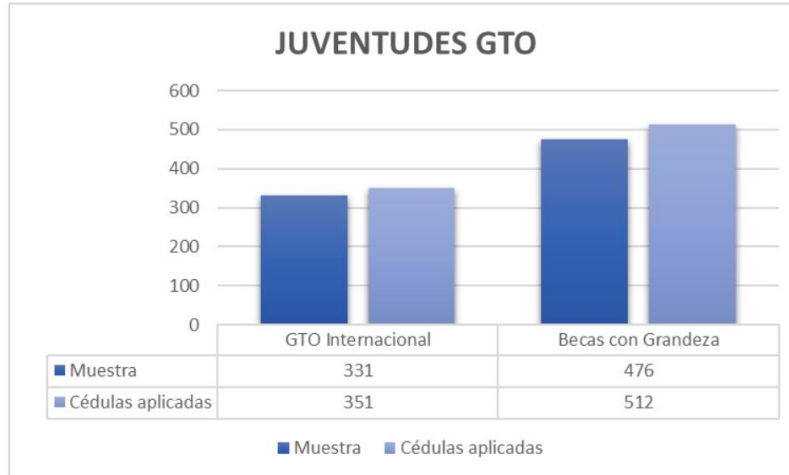
Imagen 1: Desempeño general en acciones de contraloría social en programas sociales estatales 2022/ Elaboró: Dirección de Participación Ciudadana.

100 % Cumplimiento en programas evaluados